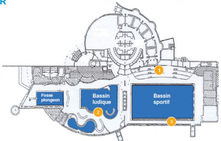
ANALYSES DES ZONES PROPICES AU DÉVELOPPEMENT DE LA TRICHLORAMINE DANS L'AIR